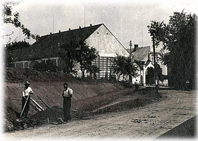
Fotografie vyrovnání zatáček, r. 1940

Konečně počalo s přípravnými pracemi skutečnými – lopatami a motykami - v úterý 25.VI. Připravován terén od Rašína, od Duškových zadních vrat a dále po návsi. Drátěný plot u Vorlova sadu č. 15 odklizen a plocha rozšířena navezenou hlínou. Po 4.VII. upraven terén za Duškovi č. 35, „za hořeníma“ skáceno se svolením majitele 6 vzrostlých hrušek, břeh probrán a oblouk do cesty tak vyrovnán i nadjezd do vsi zlepšen a výhled rozšířen.