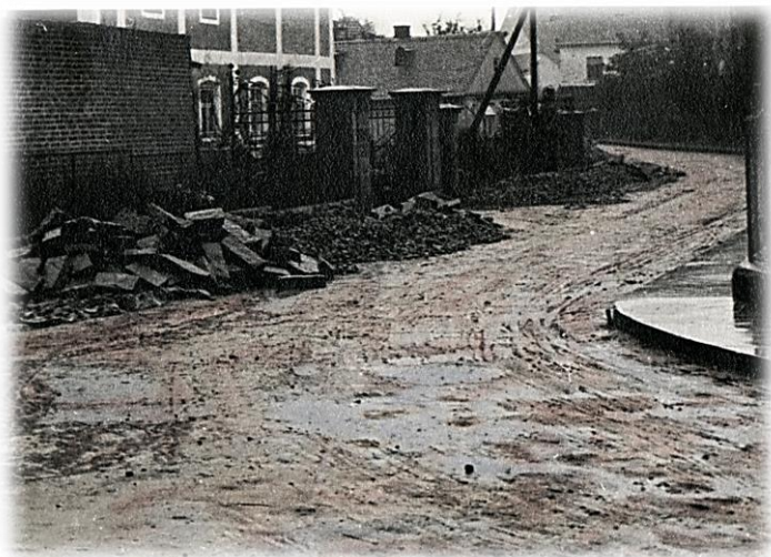
Fotografie před vlastní úpravou silnice v obci, r. 1939.