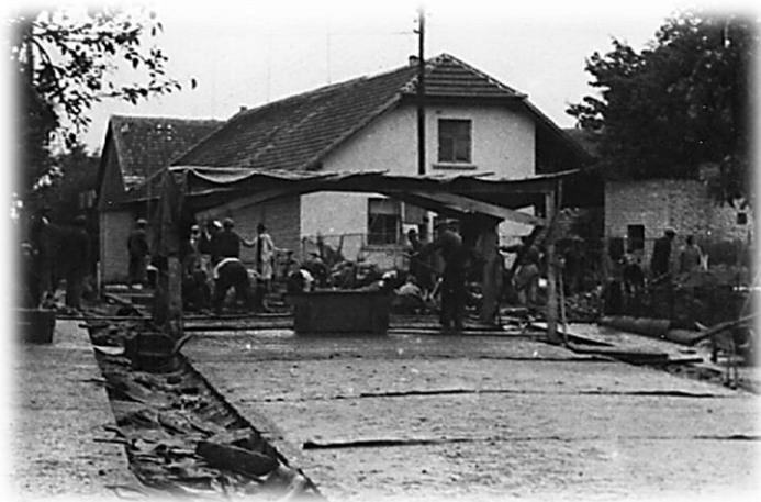
Fotografie improvizovaného přístřešku dlaždičů, r. 1940

V týdnu pokračeno za kovárnou, betonový základ i zvýšení bylo značné, obecní mostní váha – proti Slámovým č. 46 se úplně ztrácela i sádek kol mohly být nízko. Po neděli 19.VIII. práce přiblížila se ke škole, jen deště zdržovaly, dlaždiči také pracovali v nejhorším čase pod improvizovanou plátěnou střechou.